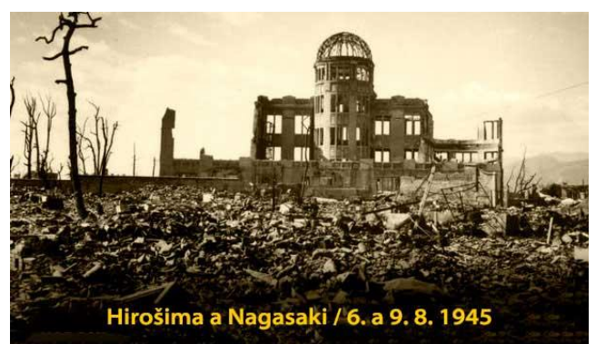
Hirošima a Nagasaki / 6. a 9. 8. 1945