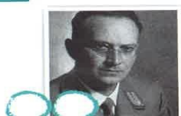
1) Jozef Tiso

A) 2. čsl. prezident v letech 1935 - 1938