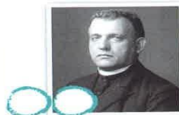
3) Konrád Henlein

B) prezident Slov. státu v letech 1939 - 1945