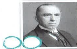
4) Edvard Beneš

C) prezident v období tzv. druhé republiky v letech 1938 – 1939