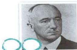
2) Emil Hácha

A) 2. čsl. prezident v letech 1935 - 1938