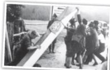
SUDET. NĚMCI VYVRACEJÍ HRANIČNÍ SLOUPY ČSR