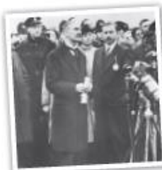
NÁVRAT CHAMBERLAINA Z MNICHOVA