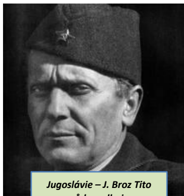
Jugoslávie – J. Broz Tito vůdce odboje

Prezident USA F. D. Roosevelt se snaží Britům pomoci alespoň materiálně. Ale i on musí respektovat americkou neutralitu. Po neúspěchu v letecké válce s Brity, kterým pomáhalo mnoho letců i z okupovaných zemí (Poláci, Češi, Slováci, Francouzi, ...) se v následujícím roce 1941 Hitler zaměří